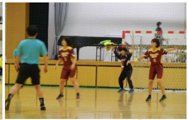
＜女子ハンドボール部関東選抜大会＞