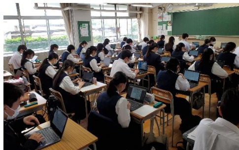
<PISA タイムの様子です>

さて、新年度(1年生は高校生活)が始まり、2か月が経ちました。学校生活は順調に送れているでしょうか。進路、勉強、部活動などいろいろ考え、悩むこともあるかと思えます。高校時代はそれを繰り返しながら成長していく時期でもあります。何かあれば遠慮せず先生方に相談してください。